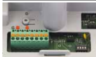
Ingebouwde stuurprint E 600/ E700 HS/E1000 (technische specificaties zie p. 192)