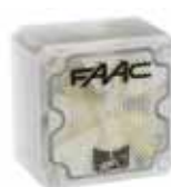
Waarschuwinglamp XL 24 L Artikelcode 410017 Prijs (€)